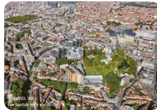
BRUSSEL 'AIR Une capitale verte vue du ciel