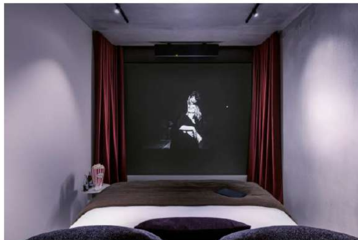
Hotel Paradiso à Paris